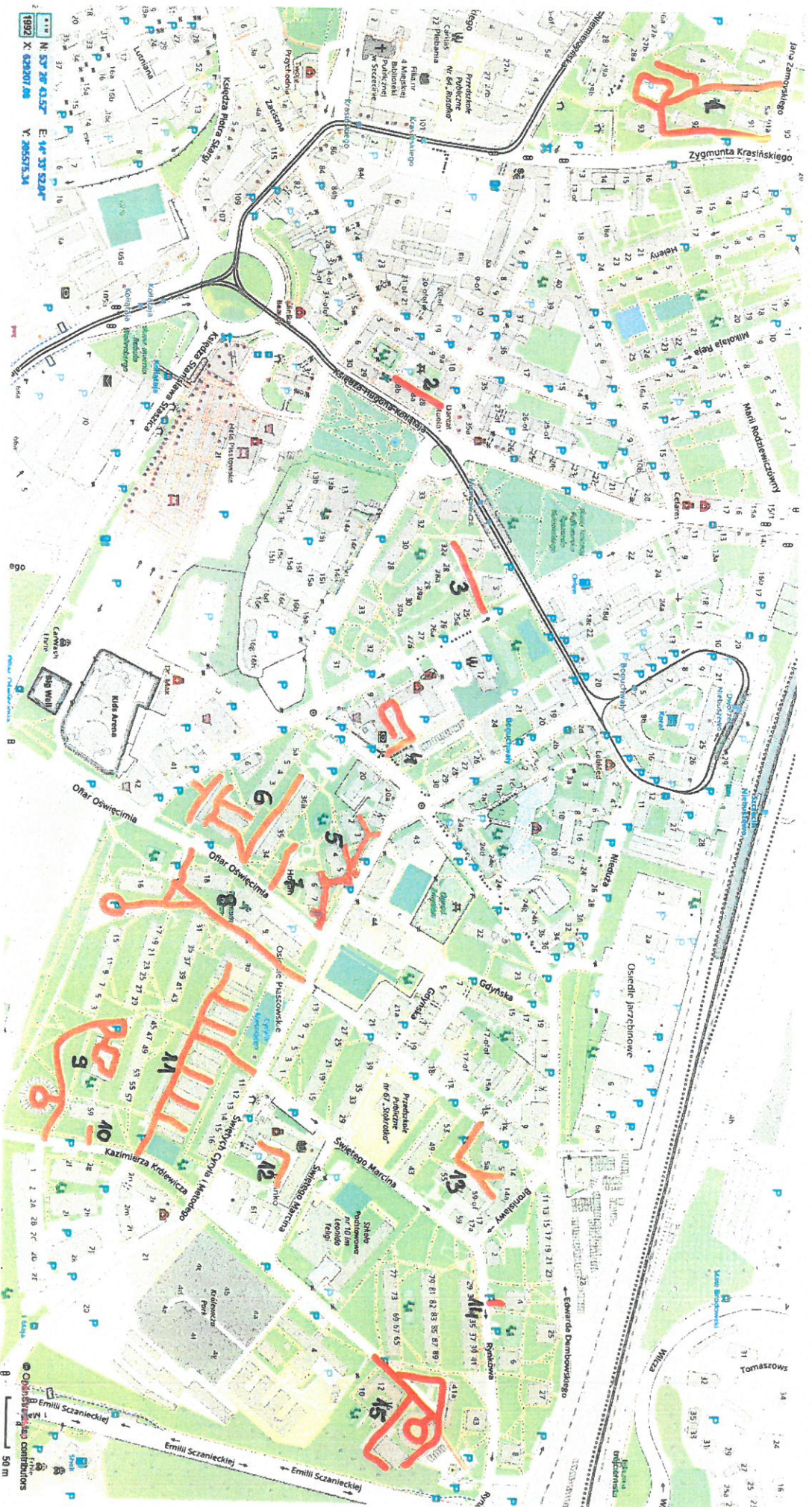
Rysunek nr 1. Poglądowa mapa z zaznaczonymi drogami wewnętrznymi (kolor czerwony) na Osiedlu Piastowskim SM „Wspólny Dom” w Szczecinie